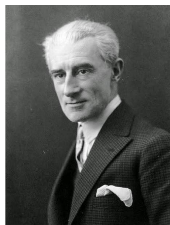
Maurice Ravel 1875 - 1937