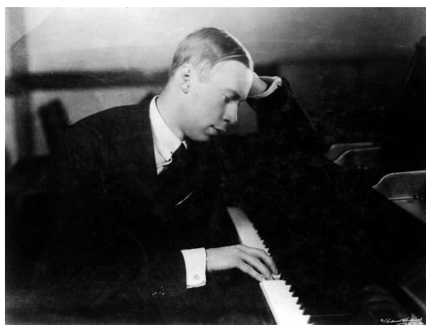
Sergueï Prokofiev 1891 -1953